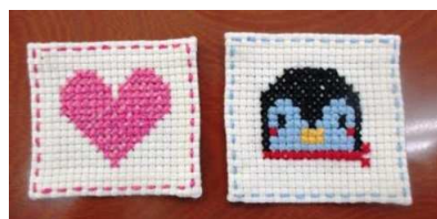
クロスステッチで作りました。 丁寧な仕事です。