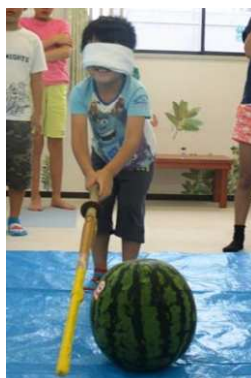
8月15日 恒例になったスイカ割り。