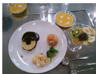
8月26日 こべっこランドで料理教室 ハンバーグ、かぼちゃのスープ、デザート