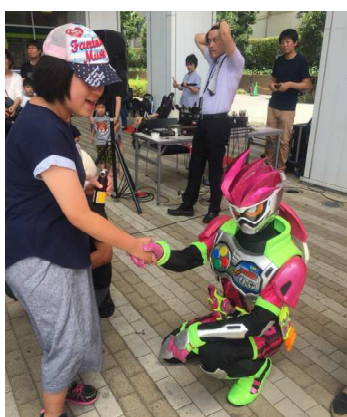
8月5日 仮面ライダーエグゼイドと握手!

※各イベントの参加費は利用料と一緒に請求させていただきます。当日、現金は必要ありません。