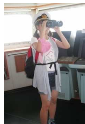
8月16日 フェリーさんふらわあの見学。 気分は船長さん。