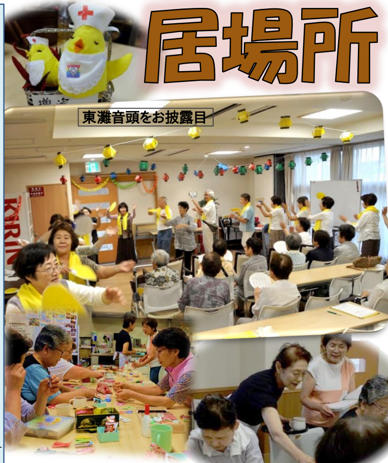
東灘音頭をお披露目