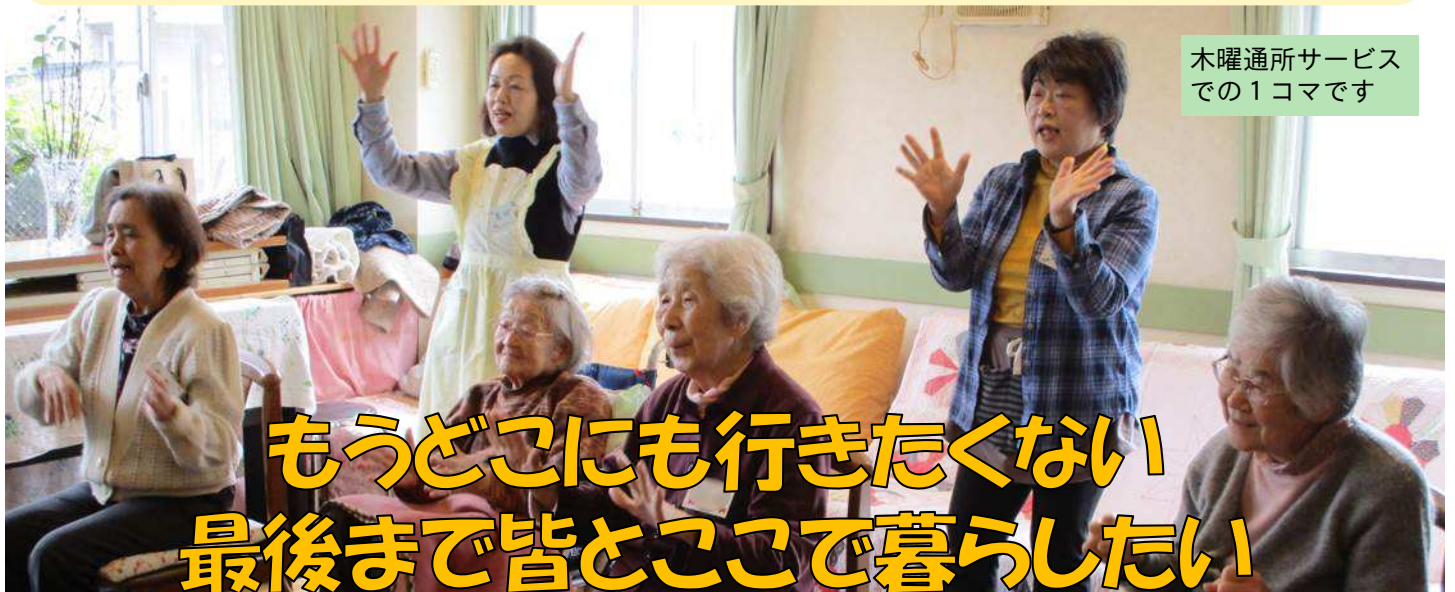
木曜通所サービスでの1コマです

この奇跡のような居場所は、そののち御影にも設立され(「ココライフ御影」)、多くの高齢者の我が家となっています。